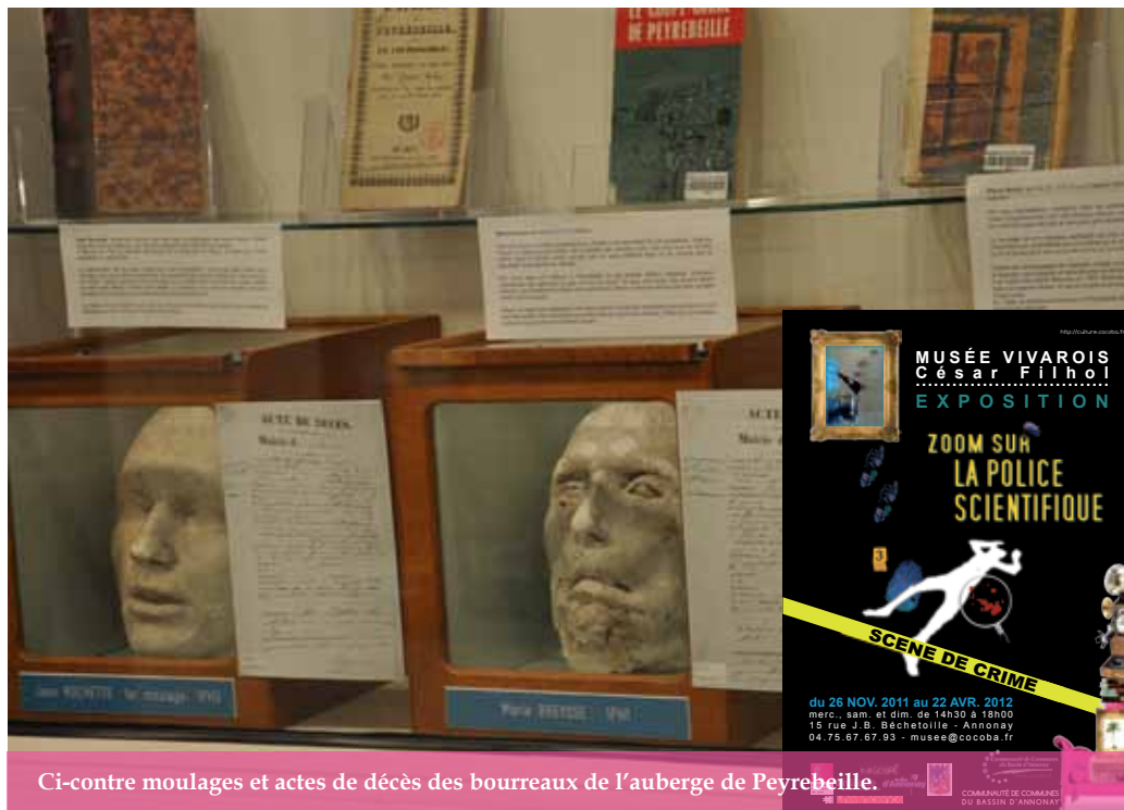
Ci-contre moulages et actes de décès des bourreaux de l'auberge de Peyrebeille.

SI VOUS ÊTES PASSIONNÉS PAR LES FILMS POLICIERS, LES SÉRIES TÉLÉ RELATANT CRIMES ET RECONSTITUTIONS, COURREZ AU MUSÉE VIVAROIS CÉSAR FILHOL.