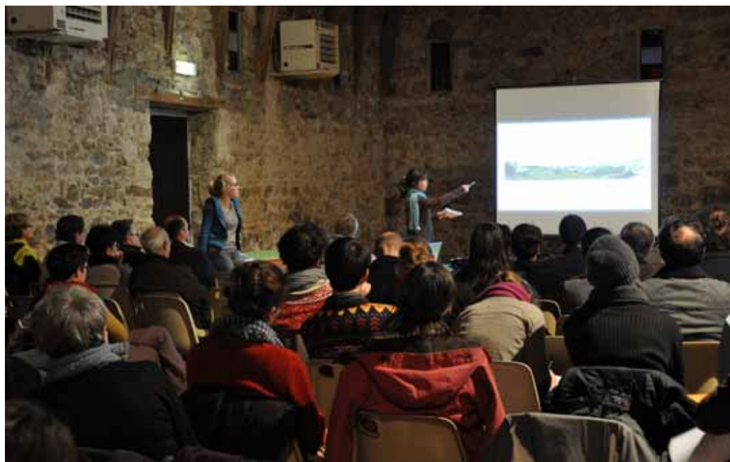
Présentation des projets des étudiants de l'école de paysage de Versailles