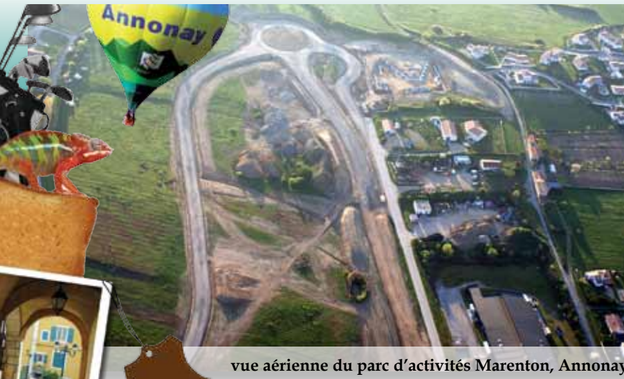
vue aérienne du parc d'activités Marenton, Annonay

2012 L'attractivité économique au cœur des chantiers de la Cocoba