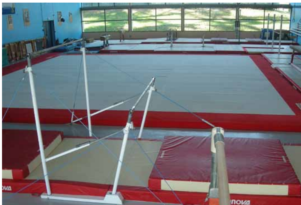
L'intérieur de la salle de gymnastique a fait peau neuve et offre du nouveau matériel

ACCOLÉE À LA HALLE GUY LACHAUD, LA SALLE SPÉCIALISÉE RÉGIS ROCHE A FAIT PEAU NEUVE. CETTE RATIONALISATION DE L'ESPACE PROFITE AUX ASSOCIATIONS DE GYMNASTIQUE DU BASSIN, MAIS AUSSI AUX SCOLAIRES.