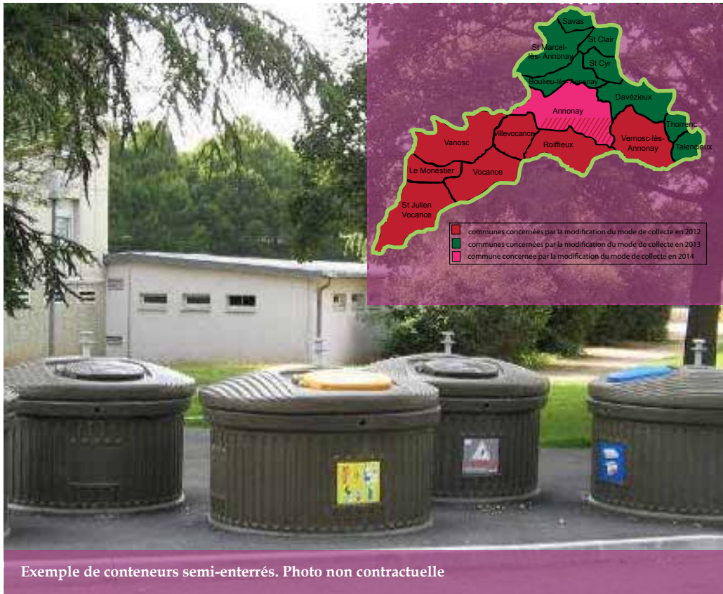
Exemple de conteneurs semi-enterrés. Photo non contractuelle