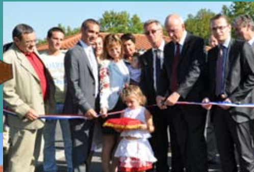
Aire d'accueil des gens du voyage