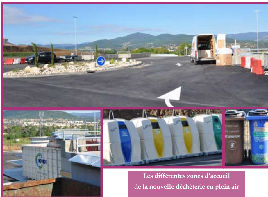
Les différentes zones d'accueil de la nouvelle déchèterie en plein air

La nouvelle déchèterie, située sur le site de Marenton, est ouverte. Cette ouverture s'inscrit dans une démarche de réflexion globale sur le respect de l'environnement et de développement durable.